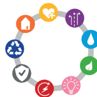
Oog voor Maassluis: balans en integratie tussen thema's

Bij iedere ruimtelijke ontwikkeling moet er voldoende oog zijn voor alle relevante thema's die in Maassluis spelen. Concreter betekent het voor de komende jaren dat door middel van visievorming de opgave wordt geïdentificeerd en doelstellingen integraal samengebracht en afgewogen. De visievorming legt de basis om functies, disciplines, partijen, belangen en geldstromen te verbinden met als doelstelling gebieden te ontwikkelen en te transformeren naar een verbeterde ruimtelijke en functionele kwaliteit.